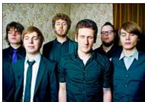
Americana: Yasemine Tourist