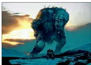
Ein Filmteam belächelt den Trolljäger, aber nicht lange

Beim Versuch, im norwegischen Bergland einem Wilderer auf die Spur zu kommen, heftet sich ein studentisches Filmteam an die Fersen des seltsamen Kauzes Hans. Der haust in einem abgewrackten Wohnwagen, trägt einen Indiana-Jones-Hut und geht nachts mit seinem Landrover auf Tour. Doch die Studenten werden eines Besseren belehrt: Hans offenbart sich als Trolljäger. Zunächst tun sie ihn als Spinner ab, müssen ihre Meinung aber schon bald gründlich revidieren. Technisch angelehnt an Filme wie „Cloverfield“, tarnt sich diese „Mockumentary“ als Dokumentarfilm, der nach dem spurlosen Verschwinden des Filmteams aufgefunden wurde. Entstanden ist dabei eine höchst vergnügliche Geschichte, die lakonischen Humor mit eindrucksvollen visuellen Effekten zu kombinieren versteht. Wenn der niemals lächelnde Hans darüber klagt, dass Überstunden nicht mehr bezahlt werden und Nachtschläge schon längst gekappt wurden, dann dürfen nicht nur Horrorfreunde lachen. Ein bombastisches Sounddesign sorgt dafür, dass es trotzdem auch ein paar Schreckmomente gibt.