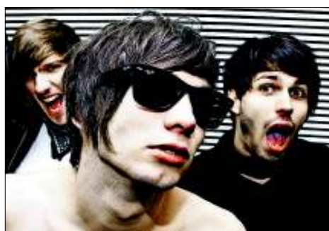
Rock'n'Roll: The Jerks

Beim Versuch, im norwegischen Bergland einem Wilderer auf die Spur zu kommen, heftet sich ein studentisches Filmteam an die Fersen des seltsamen Kauzes Hans. Der haust in einem abgewrackten Wohnwagen, trägt einen Indiana-Jones-Hut und geht nachts mit seinem Landrover auf Tour. Doch die Studenten werden eines Besseren belehrt: Hans offenbart sich als Trolljäger. Zunächst tun sie ihn als Spinner ab, müssen ihre Meinung aber schon bald gründlich revidieren. Technisch angelehnt an Filme wie „Cloverfield“, tarnt sich diese „Mockumentary“ als Dokumentarfilm, der nach dem spurlosen Verschwinden des Filmteams aufgefunden wurde. Entstanden ist dabei eine höchst vergnügliche Geschichte, die lakonischen Humor mit eindrucksvollen visuellen Effekten zu kombinieren versteht. Wenn der niemals lächelnde Hans darüber klagt, dass Überstunden nicht mehr bezahlt werden und Nachtschläge schon längst gekappt wurden, dann dürfen nicht nur Horrorfreunde lachen. Ein bombastisches Sounddesign sorgt dafür, dass es trotzdem auch ein paar Schreckmomente gibt.