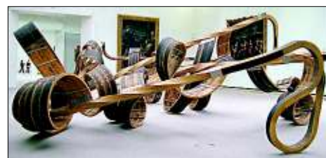
Durch den Freundeskreis der Staatsgalerie finanziert: Richard Deacons „Red Sea Crossing“