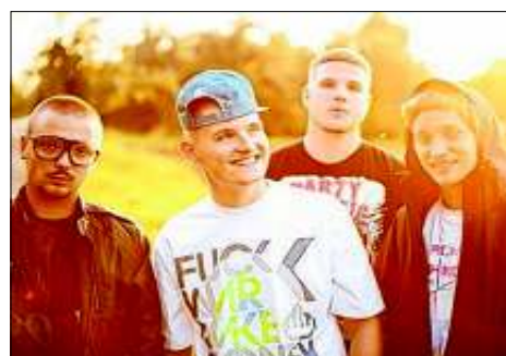
Hip-Hop: Die Orsons